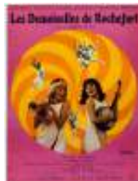
Les demoiselles de Rochefort (Film)