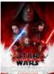
Le dernier Jedi (Film)