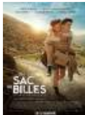
Un sac de billes (Film)