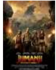
Jumanji. Bienvenue dans la jungle (Film)