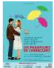
Les parapluies de Cherbourg (Film)